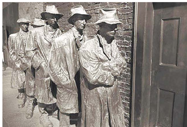
Действительность может оказаться еще хуже памятника Великой депрессии

Приемы, конечно, известные. Но жизнь рождает