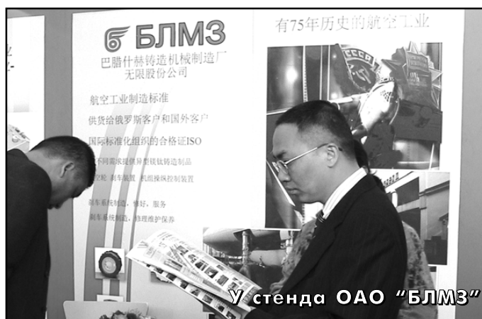
У стенда ОАО "БЛМЗ"