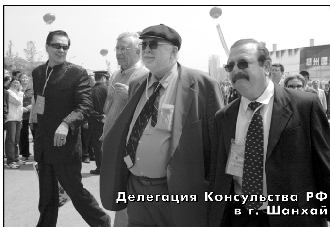
Делегация Консульства РФ в г. Шанхай