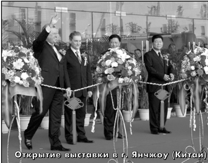
Открытие выставки в г. Янчжоу (Китай)

Завершилась деловая поездка делегации городского округа Балашиха в город-побратим Янчжоу (провинция Цзянсу Китайской Народной Республики) – радостное и торжественное мероприятие. Каждый участник поездки почувствовал себя частью коллектива единомышленников, участвующих в большом и важном деле по объединению усилий двух великих народов в направлении дружбы, сотрудничества, в развитии культурного и делового обмена.