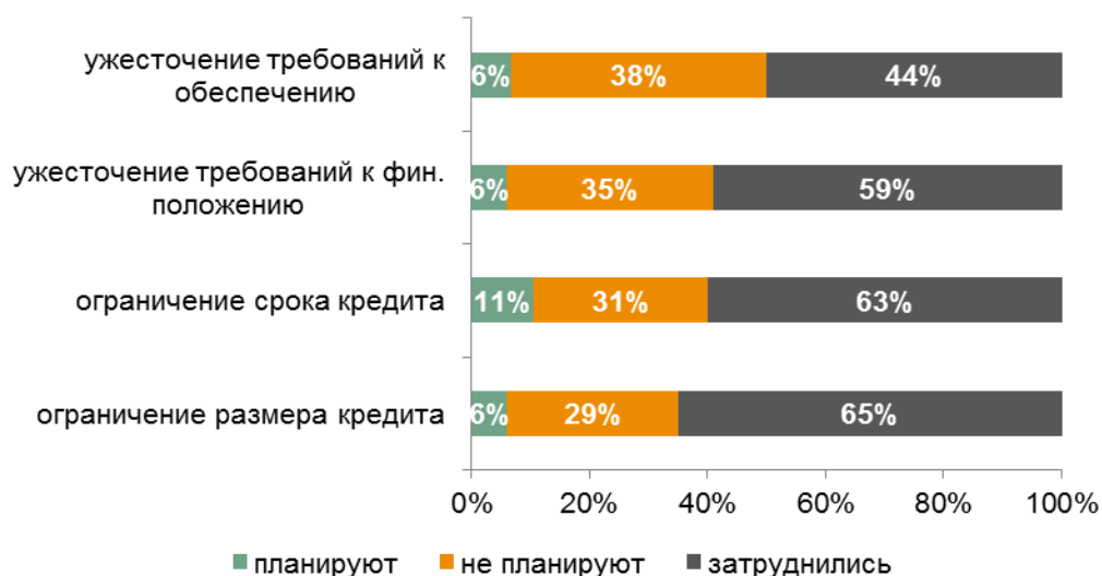
Рис. 4. Планы по дальнейшему ужесточению условий кредитования МСП в 2015 году.

*В процентах от числа ответивших на вопрос респондентов (17).