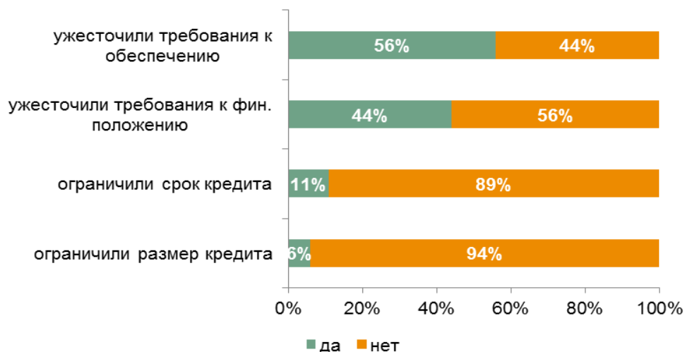
Рис. 3. Ужесточение условий кредитования МСП в декабре 2014 году

*В процентах от числа ответивших на вопрос респондентов (18).