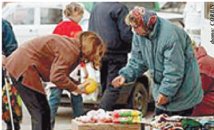
Если «лавочников» станет много, еще неизвестно, удастся ли клеркам сохранить свою власть?

Нынче управлять экономикой берется любой клерк. В Барнауле владелец парка отдыха решил построить на своей территории открытый аквапарк. Не разрешили. «Так невыгодно же, лето у нас короткое!» – заботливо пояснили предпринимателю в мэрии. «Но это ж мое дело, я, если что, буду в убытках!» Между тем аквапарк – это рабочие